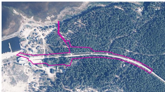
Suunnittelualue ilmakuvan päällä.